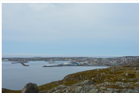
Ville de Saint Pierre, ©Pascal Le Floc'h

Des travaux récents décrivent la trajectoire de croissance de l'archipel de Saint-Pierre et Miquelon depuis la fin de l'exploitation industrielle de la morue en 1992.